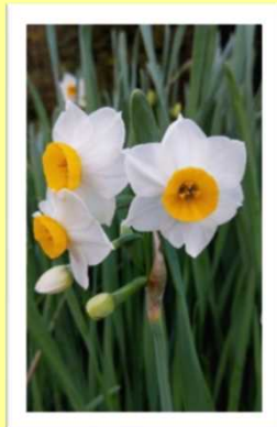
散歩コースにも冬の訪れを感じます。 (乳がん)