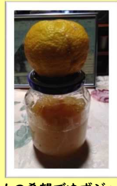
主人の希望でゆずジャムを作りました (ご家族)